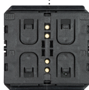
ZF AFIM-1010 KNX-RF 2-Wege Tastmodul