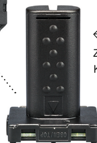
ZF AFZM-0001 KNX Programmieradapter