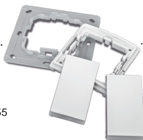
EHAK02 Montageset für Funktaster