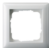
1-fach Rahmen Gira Standard55