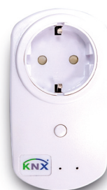
MDT RF-AKK1ST.01 KNX RF Steckdose

Die KNX RF Schnittstelle ermöglicht die Kommunikation mit KNX RF Geräten und zudem, auch die kabellose Programmierung per KNX RF Medienkoppler. Mit der KNX RF Funksteckdose lassen sich kabellose Schaltfunktionen ohne Gefahr des Berührens spannungsführender Teile durchführen.