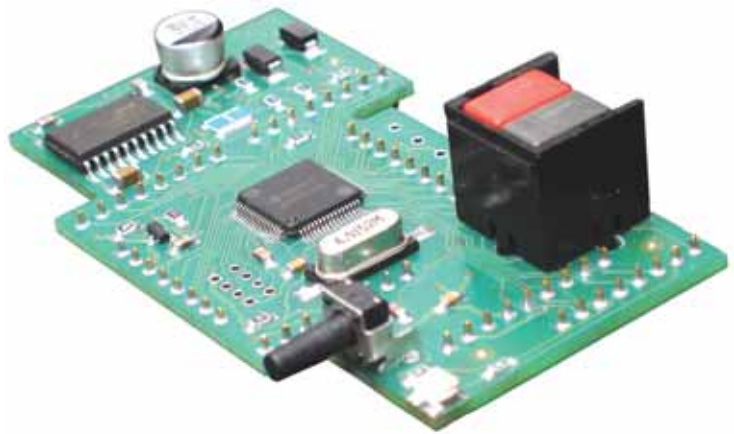
Bild 2. Flachbaugruppe zum Testen von Applikationen